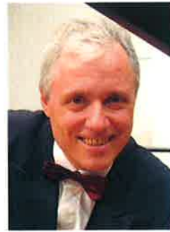
(第2次審査～本選) パスカル・ドヴァイヨン (ピアニスト/フランス)