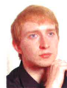
German KITKIN German KITKIN ロシア / Russia 1994生まれ / Born in 1994 23才 / Age:23