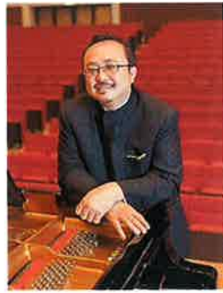
ダン・タイ・ソン (ピアニスト/ベトナム)