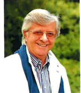
ピオトル・パレチニ (ピアニスト/ポーランド)