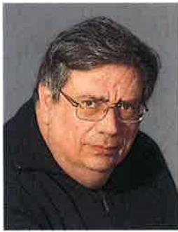
ガインチェツォ・バルツァーニ (ピアニスト/イタリア)