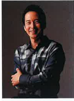
青柳 晋 (ピアニスト/日本)