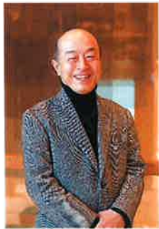
池辺 晋一郎 (作曲家/日本)