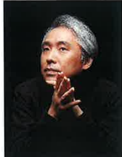
(本選のみ) キム・デジン (ピアニスト/韓国)