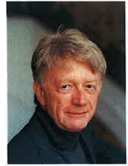
クラウス・ヘルヴィッツヒ (ピアニスト/ドイツ)